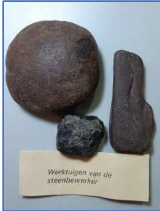
Werktuigen van de steenbewerker