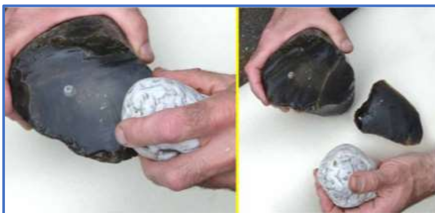
Kernsteen met klopper en afslag.

In de Steentijd maakten de late Neanderthalers en de vroege moderne mensen klingen uit vuursteen door het slaan van een lange smalle scherf ( afslag ) van een stenen kern ( kernsteen ). Een kling is een voorwerp dat vervaardigd werd om mee te snijden of werd als slag- of steekwapen gebruikt. Voor het creëren van een kling is een klopsteen nodig. Klingen werden daarna verder bewerkt tot vuistbijlen, hakken, schrapers, beitels, pijlpunten, of stekers. Soms werd een zijde door het verwijderen van kleine scherven afgestompt om een eenzijdig snijdende kling te verkrijgen. Zie onderstaande afbeelding 1 .